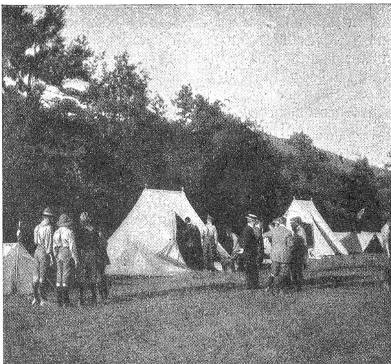
Zeltlager der Pfadfinder.

uns fand, was er sich versprach. Und wiederum: Nicht alle Führer und Pfadfinder sind das geworden oder werden noch, was die Pfadfinderei aus ihnen hätte machen sollen: „Brauchbare, aufrechte, tüchtige Männer! Auch mit