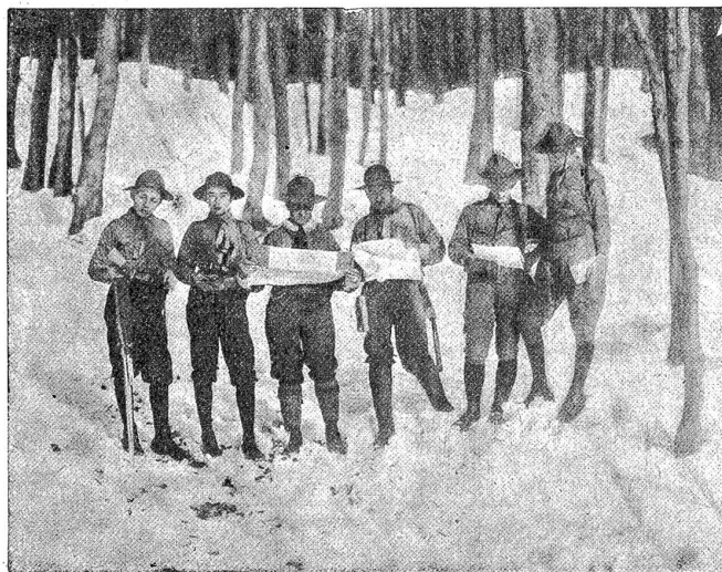
Pfadfinder beim Kartenlesen.