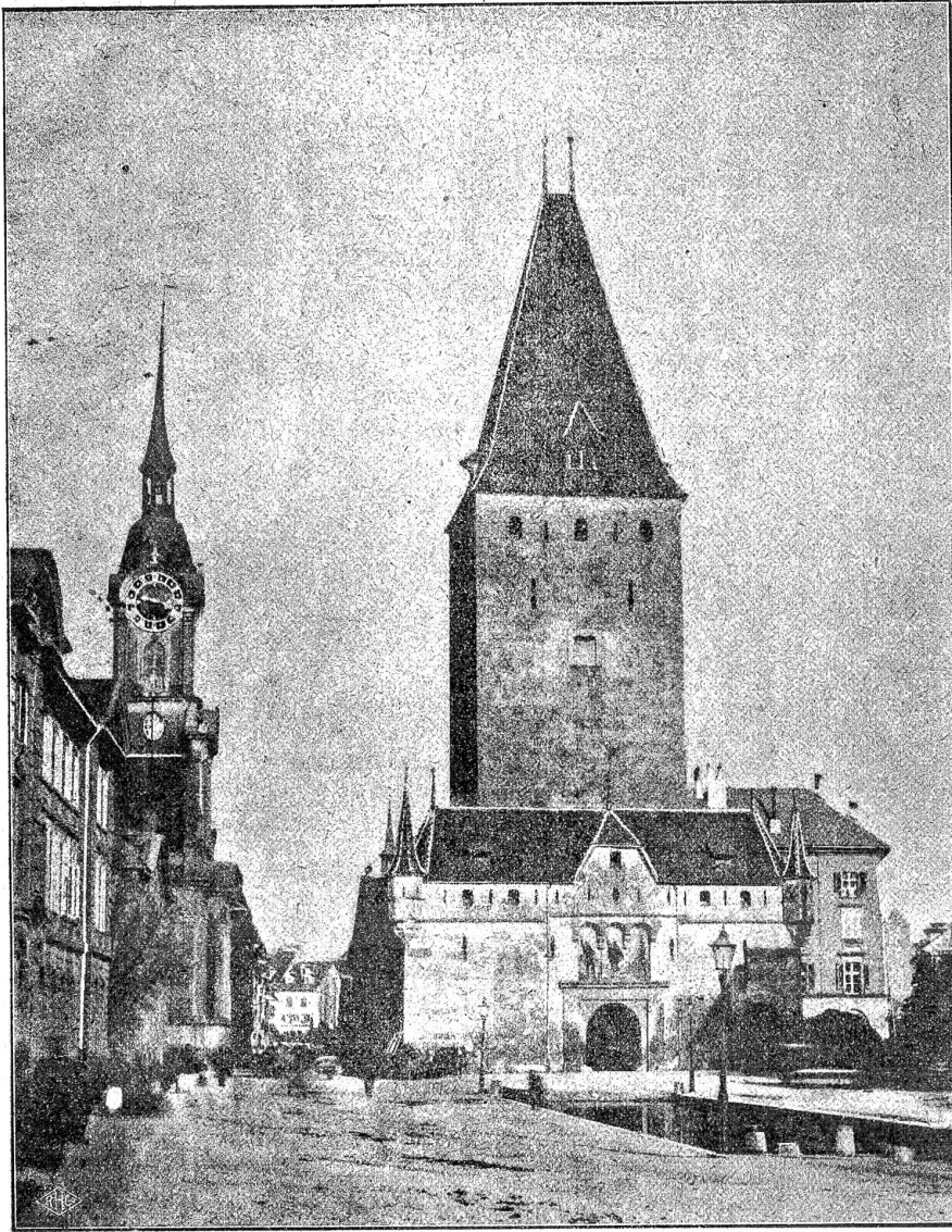
Der Christoffelturm oder Goliathenturm oder Oberspitalturm von der Westseite gesehen, abgebrochen 1864. Auf seiner Unterseite, in einer mächtigen Nische, stand das hölzerne Bild des heiligen Christophorus, der Christus auf der Schulter trug. Später wurde daraus ein Goliath mit Helm und Hellebarte. Ihm gegenüber stand auf dem Brunnenstock David mit der Schleuder. Kopf, Hand und Fuß der Christoffelfigur sind bekanntlich im Historischen Museum Bern zu sehen.

Aber wart, dir will ich eine Krone aufsetzen, du Rünglein! Gebt den Ring!"