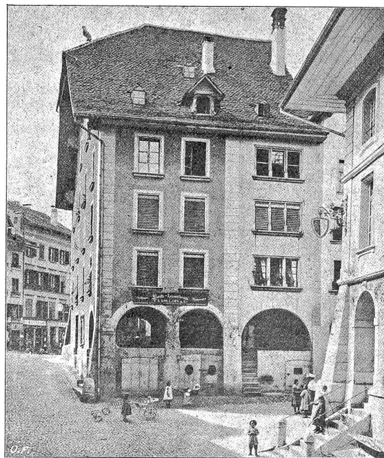
Das Sankhausersche „Großhaus“ in Burgdorf. Hohe-Gasse-Kirchbühl Ecke (Haus rechts stehend).