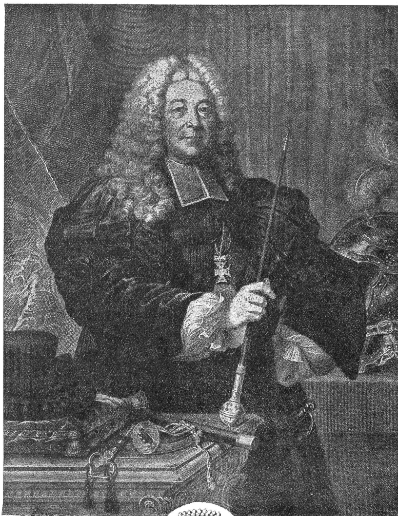
Hieronimus Herr zu Hindelbank, Matstetten, Seedorf des Rothens, Adlers Schultheiß der Stadt Hno. Rom. Keys- und Cäs. Könige May General Feld- u. Marschal. Leute, auch General v. d. Rode, Bern im XVIII. Jahrhundert. Verlag N. Francke, Bern. von Erlach Orten, Bariswil, und Thunstetten, und S. Äuberti Ordens Ritter und Republik Bern. Carl des VI. Wurekl. Cammer Herr Obrister über ein Regiment Fusvolk. Gegeben den 28. Februario 1744. Ergeben im 1748.