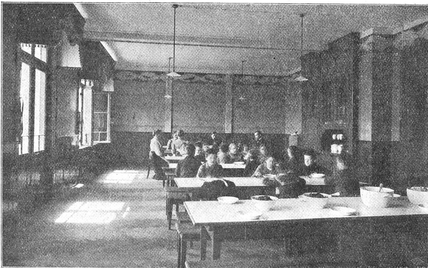
Speisesaal der Anstalt für schwachsinnige Kinder in Burgdorf.

Für viele Menschen ist das rückblickende Erleben eine Quelle der Kraft für den Kampf im Alltag. Man könnte füglich von einem Menschentypus reden im Hinblick auf die Leute, die ihre Lebensmaximen bei dieser retrospektiven Welt- und Lebensbetrachtung erwerben. Sie verklären alles Vergangene unbewußt mit der Poesie der Erinnerung; während ihnen die eigene Jugendzeit in rosigem Lichte erscheint, sehen sie die Gegenwart und die Zukunft schwarz vor sich liegen. — Ein interessanter Vertreter dieses Menschentypus ist der Berner Kunstgelehrte und Zeichner Franz Sigmund Wagner (1759—1835), der zu Anfang des vorigen Jahrhunderts als Anreger, Kritiker, Schriftsteller und Künstler in unserer Stadt eine nicht geringe Rolle gespielt hat. Es gab kaum eine künstlerische oder gesellschaftliche Veranstaltung größeren Stils, keine das Berner Kunstleben betreffende Neugründung, an der nicht Sigmund Wagner als Anreger oder Organisator oder künstlerischer Beirat