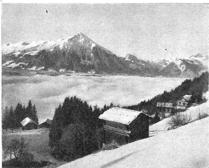
Rebermeer über dem Chunersee mit Blick auf die Riesenkette.

Als er jedoch abends, ein bißchen angeraucht, wie er schmunzelnd zu dem lachenden Bethli sagte, vom Taufschmaus heimkam und eben über den zwanzigmal gelesenen Marienkalender einnicken wollte, wurde behutsam die Türe aufgetan und Portiunkula, seine ältere Tochter, trat hüftelnd, wie ein kalter Luftzug, in die Stube. „Guten Abend,