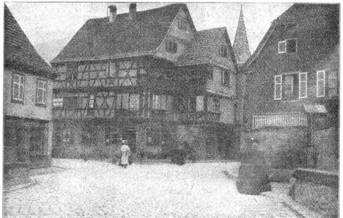
Altes haus in Kapsersberg.

Von Kolmar nach Schnierlach (Lapoutroie) im Tal der Béhine fährt ein höchst gemütliches Bähnchen. Das kennt in unserer jagenden, hastenden Welt den Wert der Zeit noch nicht, oder schätzt ihn wenigstens gering ein. Es kümmert sich wenig drum, ob's eine halbe oder ganze Stunde früher oder später ist und hat auch dann immer noch Zeit, da und dort dem Reisenden Gelegenheit zu einer Landschaftsbetrachtung zu geben, auf daß man nicht versucht