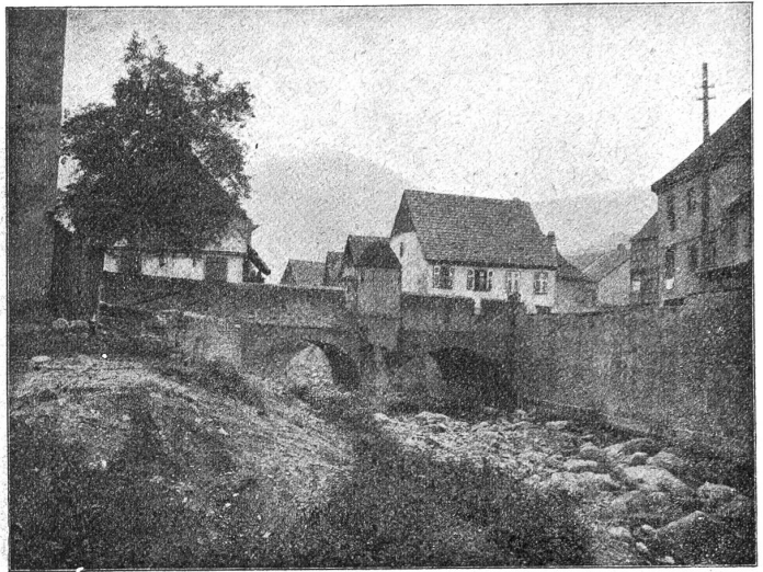
Befestigte Brücke der Weiss in Kaysersberg.

Ein kleiner, genußreicher Spaziergang und auch der letzte der drei Orte, zugleich der wichtigste, war erreicht, Kaysersberg. Es ist wirklich eine Krone elsässischer Landstädtchen, hat noch ganz mittelalterlichen Charakter, als wäre es das alte Reichstädtchen von anno dazumal. Mauer, Turm und Wall findet sich vor. Winkelige Gassen und Gäßchen mit anspiegender Architektur bilden für jeden Freund alter Bauart ein wahres Dorado. Gerne gedenkt man des genialen Hohenstaufenkaisers Friedrich II., der 1226 den Ort zur kaiserlichen Stadt emporhob. Die Kaysersberger sind stolz auf ihren Ort, ihre hübschen Giebelhäuser mit den feingeknickten Erkern, das schöne Rathaus im