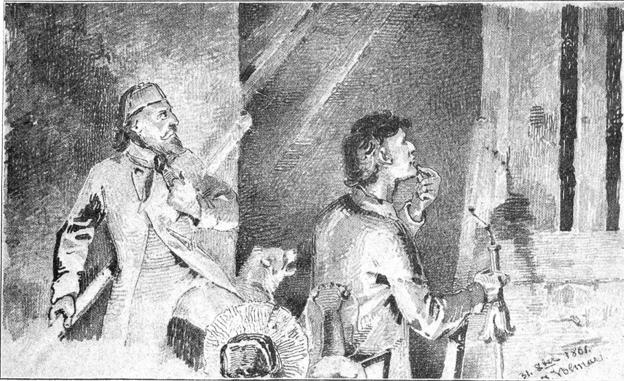
J Volmar: Spukhaftes aus Bern-Altstadt. Das Geräusch im Frienisbergerhaus.

fehlen, so erzählen Sie uns ein wenig, wer Sie sind und woher, und was Sie da auf Reisen suchen.“