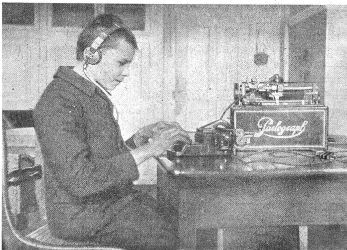
Am Parlograph: Uebertragung des Diktats in Blindenschrift.