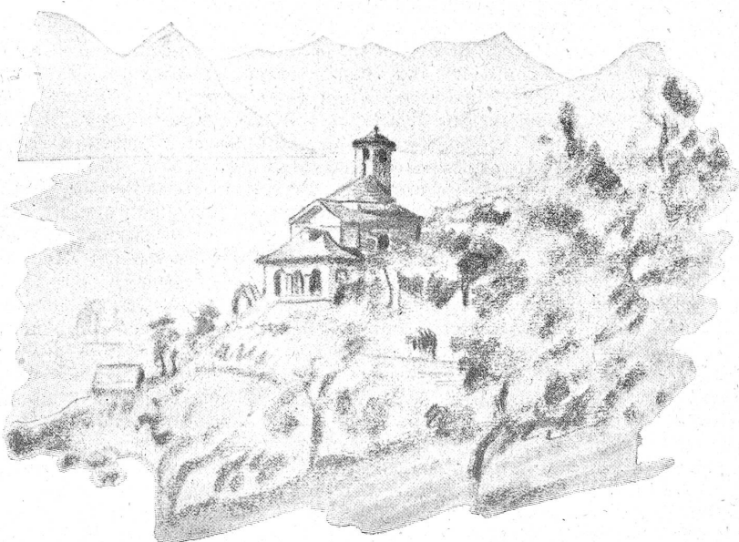
Bei Gordola. (Aus dem Skizzenbuch von E. Balmer.)