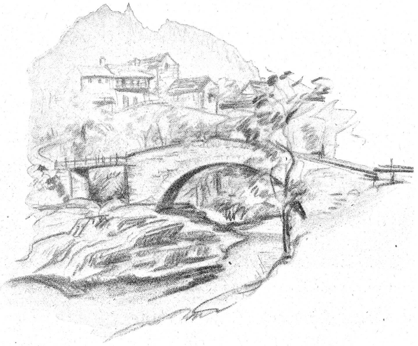
Labertezzo. (Aus dem Skizzenbuch von E. Balmer.)

Andern Tags bin ich dann das ganze Verzascatal hinabgewandert. Das schönste in diesem Tal ist das wunderbar grünklare Wasser der Verzasca; das hat ja dem Fluß und dem Tal auch den Namen gegeben. Ich konnte nicht genug hinabschauen in die grünen Wellen und sie zogen mich an wie die Loreley den Fischer. Zweimal stieg ich hinab und tauchte mich in die eiskalte, kristallklare Flut — es ging mir aber nicht wie selbigem Fischer, sondern ich stieg herrlich erfrischt aus dem kalten Bade — alle Müdigkeit war verschwunden. Ich zog weiter über geschwungene Steinbrücken — hoch oben an steilen Berghängen klebten malerische Nester — Reben kamen, dann Mais, dann Rosen — immer üppiger wurde die Pflanzwelt und auf einmal blaut durch dunkle immergrüne Bäume der Lago Maggiore! — Mit einem Taucher habe ich ihn wiedergegrüßt. Nun hatte ich ihn doch erreicht, den blauen Verbano, an dem ich letztes Jahr vergebens Genesung gesucht und dessen Wellenschlag ich gelauscht in langen, schlaflosen Nächten! — Doch heute schien er mir viel schöner, und die düstern Wolken waren verweht. — In Locarno empfing mich Freund Ermanno und seine liebenswürdigen Schwestern brachten mir die erste Erfrischung. — Und jetzt bin ich in Ascona bei meinen lieben Freunden. Ich sage Dir, Hansli, die Aufnahme, die mir hier zuteil wurde, hat alle meine Erwartungen weit übertroffen. Mit Beppino ging ich gleich nach der Ankunft zum See. Drei Stunden blieben wir am