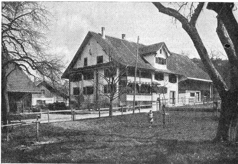
Der Göttschhof, Hauptgebäude.

„Gewiß — sie sind aus Elektrizität geboren.“