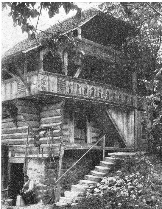
Der „Zehn-Jungfrauen-Speicher“ in Goldbach bei Lützelflüh. Mit bemerkenswerten schmückenden Malereien, die der Gegenwart unlängst wieder geschenkt wurden.

Reisetasche hervor, beschaute sie auch nochmals und warf sie ebenfalls auf den Tisch; es gab einen ganz artigen Haufen.