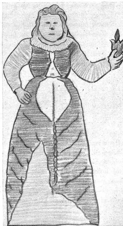
Eine der klugen Jungfrauen vom Speicher in Niedergoldbach. Nach einer Farbstiftzeichnung von Architekt A. Brändli, Burgdorf.