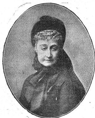
Eugenie von Montijo

Der Tod der Ex-Kaiserin weckt die Erinnerung an die Beziehungen, die Eugenie durch ihr Schloß am Untersee mit der Schweiz pflegte. Bekanntlich hat die Mutter Louis Napoleons, die Frau Gemahlin Louis Napoleons, einst König von Holland durch seines großen Bruders Gnade, vor den Metternichschen Verfolgungen im Kanton Thurgau Zuflucht gefunden. Königin Hortense weilte Ende 1816 und anfangs 1817 in Konstanz als Gast der Großherzogin von Baden, einer ihrer Verwandten. Doch war hier ihr Bleiben nicht, sie sollte auf Befehl der Mächte Baden verlassen. Da nahm sich die thurgauische Regierung der gehezten Königin an und bot ihr den Aufenthalt auf thurgauischem Boden an. Von der Konstanzer Familie v. Streng erstand sich dann Hortense das Landhaus Arenenberg bei Ermatingen und bezog es mit ihrem damals 10jährigen Sohne Louis. Sie verblieb hier trotz des Einspruchs der Mächte; denn die Thurgauer blieben standhaft. Das Landhaus wurde nun von Grund aus umgebaut und bekam so sein heutiges