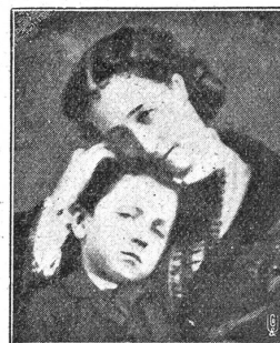
Kaiserin Eugenie mit dem Prinzen „Loulou“.

Nun kam das Schicksal mit raschen und schweren Schlägen über die schöne Frau. Am 2. September kapitulierte Sedan, am 3. wurde ihr Gatte als Gefangener auf Schloß Wilhelmshöhe abgeführt. Am 4. September erfuhr Paris den Zusammenbruch und sogleich erhob sich das Geschrei: „Absetzung! Republik!“ Im Stadthaus proklamierte Gambetta die Thronentsetzung der Napoleonischen Familie auf ewige Zeiten. Um 1 Uhr nachmittags verließ die Kaiserin die Tuileries, um nie wieder dorthin zurückzukehren. Sie