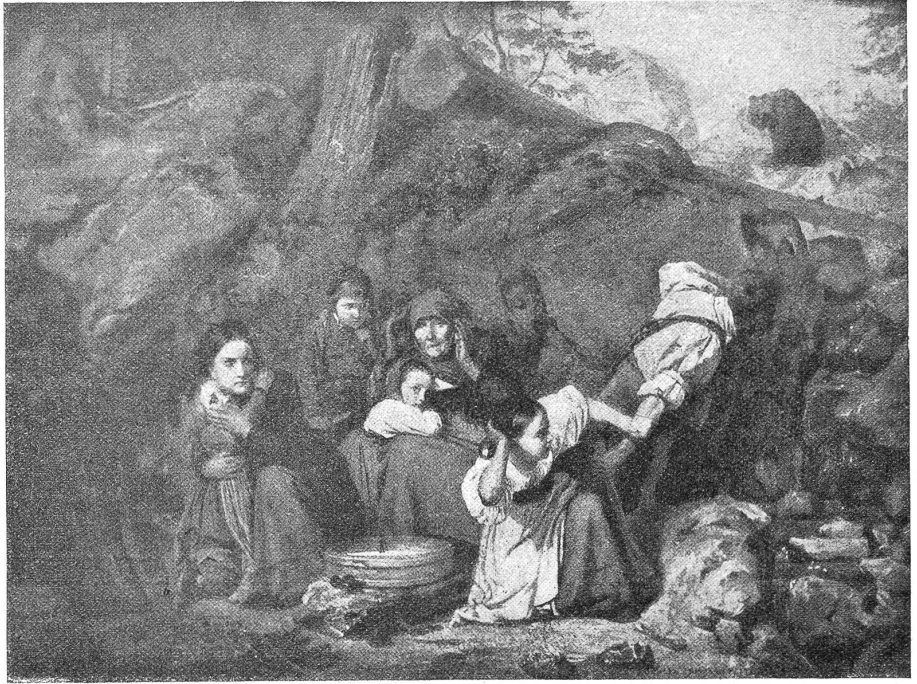
Eduard Girardet (1819—1880).

Eine friedlichere Szene zeigt das untenstehende, letzte hier reproduzierte Bild, das, wiederum dem realistischen Zeitgeschmack entsprechend, eine ländliche Gantsteigerung dar-