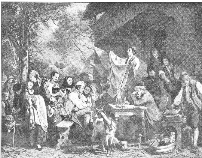
Eduard Girardet (1819—1880).

An Stelle der heutigen Nydeggkirche stand schon vor der Gründung der Stadt Bern und eine geraume Zeit nachher noch eine Burg. Diese Tatsache ergibt sich aus den Berichten der Berner Chroniken und aus den Mauerüberresten, die beim Bau der neuen Nydeggbrücke und bei andern Anlässen zutage traten und die heute noch an der Kirche, an Kellerfundamenten von Gebäuden an der untern Gerechtigkeitsgasse und beim Klapperlächli, in Hausmauern am Stalden und an der Mattenenge und anderswo konstatiert werden können. Wenn auch diese Mauerfragmente die Existenz der Nydeggburg zur Evidenz beweisen, so bedeutet es doch kein geringes Untersuchen, an Hand der spärlichen Chronikstellen und ebenso spärlichen Steinzeugen eine Rekonstruktion der Burg zu versuchen. Dieser Versuch liegt uns vor in der Arbeit des Berner Architekten und verdienten Lokalhistorikers Eduard von Rodt; sie ist im November letzten Jahres im Verlag von A. Francke, Bern, erschienen*) und verdient die Beachtung eines weitem Publikums. Durch die Liebenswürdigkeit des Verfassers und des Verlegers ist es uns möglich geworden, unsern Lesern eine zwar stark