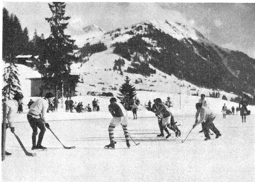
Hockey-Match in Gstaad.

gezogen von rennlustigen Pferden mit munterem Geschell. Andere, Damen und Herren, ziehen dem Fahren einen Ritt durch die sanfte Schneebahn vor. Wenn der Völkerbund in Versailles auch so aussähe wie hier, in dieser Internationale, wären wir Helvetier willig, beizutreten.