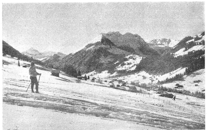
Partie bei Gstaad. Blick aufs Oldenhorn.

Wißt ihr in der Bundesstadt, daß die Häuser des Simmentals bekannt sind durch ihre Sauberkeit und Nettigkeit? Im Sommer werden wieder prangende Nelken und anderer Blumenflor die blinkenden Fenster schmücken und einladend winken. Ja, die Simmentaler dürfen sich schon einige Zier leisten; sie haben zwar schmalen, aber fruchtbaren Talboden, schöne Alpen, berühmte und einträgliche Viehzucht, große Viehmärkte, beträchtlichen Handel.