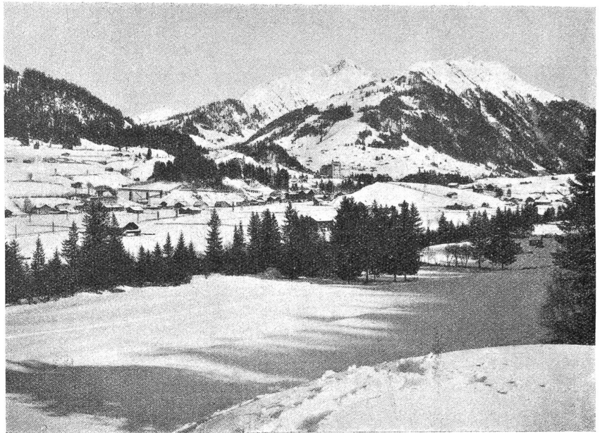
Gstaad von Westen aus gesehen. Im Hintergrund das Giffhorn.

Das Dorf mit seinen wohlgebauten heimatlichen Holzhäusern macht einen behäbigen Eindruck. Die vielen Verkaufsläden zeigen, daß hier das Verkehrszentrum und der Marktsiedel des Tales ist. Das große „Landhaus“ mit seinem Kranich erinnert an vergangene Zeiten, da noch die Grafen von Greyerz hier geboten, auch die große Kirche mit dem stattlichen Turm und die dabeistehende Kapelle haben wohl schon manches Geschlecht kommen und gehen gesehen.