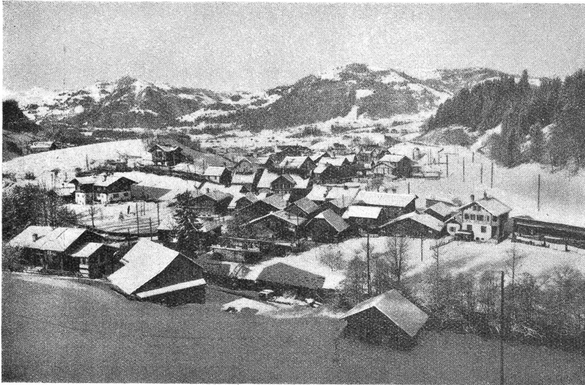
Das Dorf Gstaad.

gibt aber noch größere Künstler am Amboß, als du einer bist!" schnauzte er ihn an; „deswegen kannst du ruhig fort, wenn dir's bei mir auf einmal so heillos verleidet ist.“