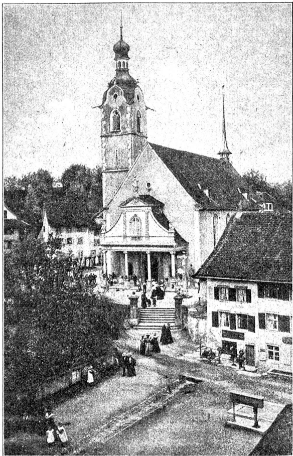
Luzernische Landstädtchen: Die Stiftskirche zu Stephan in Münster.

kann. Und das Dunkel unter dem Orgelbau, das sonst so viele Andächtige birgt, die dort zu einem steinernen Christus beten, der im Grabe liegt, ist heute wirklich bloß ein Dunkel ohne anderen Inhalt als feuchte, dumpfige Luft.