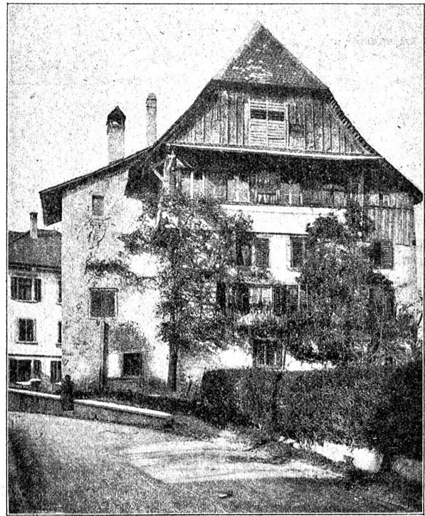
Luzernische Landstädtchen: Das Haus zu Münster, wo die erste Buchdruckerei der Schweiz gestanden (1470).

Behausung des Truchsessens von Wolhusen, kam es im 15. Jahrhundert in den Besitz des Chorherrn Helias von