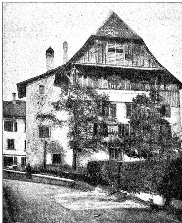
Luzernische Landstädtchen: Das Haus zu Münster, wo die erste Buchdruckerei der Schweiz gestanden (1470).