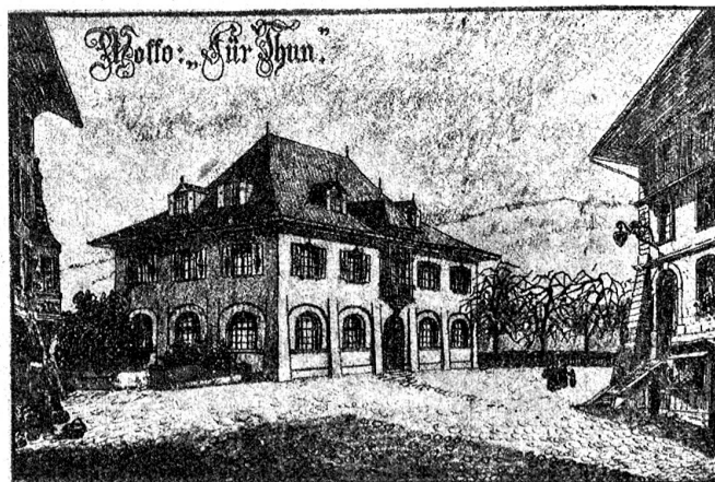
Aus dem Wettbewerb für Gemeindestuben und Gemeindehäuser: „Für Thun“. Ehrenmeldung. Verfasser: Arch. Hauser & Winkler, Zürich. In der Architektur den lokalen Verhältnissen angepaßt.

dorf. Es hat heimelige Plätzchen (Ofenecke!) und eine gediegene heimatschühlerische Ausstattung. (Abb. S. 28.)