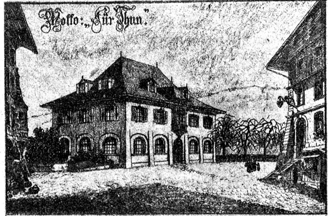
Aus dem Wettbewerb für Gemeindestuben und Gemeindehäuser: „Für Thun“. Ehrenmeldung. Verfasser: Arch. Hauser & Winkler, Zürich. In der Architektur den lokalen Verhältnissen angepaßt.

dorf. Es hat heimelige Plätzchen (Ofenecke!) und eine gediegene heimatschühlerische Ausstattung. (Abb. S. 28.)