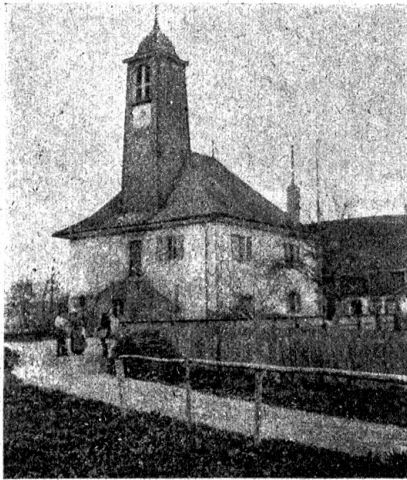
Aus dem Wettbewerb für Gemeindegaststuben und Gemeindegasthäuser: „Bottens“. I. Preis. Verfasser des Projektes: Arch. B. S. A. Georges Epitaulx, Lausanne.

Die Augen des Kindes haben sich drinnen seit gesehen, jetzt wenden sie sich dem Lichte zu. Das grüne Tal lockt herauf. Ein eiliger Bach rauscht unten vorbei. Aber es