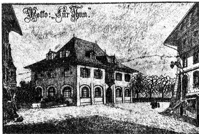
Aus dem Wettbewerb für Gemeindestuben und Gemeindehäuser: „Sür Thun“. Ehrenmeldung. Verfasser: Arch. Hauser & Winkler, Zürich. In der Architektur den lokalen Verhältnissen angepaßt.

dorf. Es hat heimelige Plätzchen (Ofenecke!) und eine gediegene heimatschühlerische Ausstattung. (Abb. S. 28.)