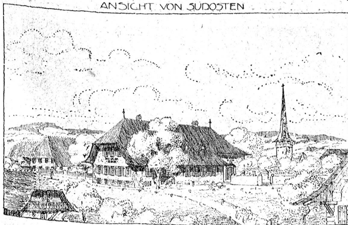
Aus dem Wettbewerb für Gemeindestuben und Gemeindehäuser: „Bärnbiet“. Ehrenmeldung. Arch.: Ed. Lanz, Charlottenburg. Das Gemeindehaus ist als heimeliger Berner Gasthof gedacht.