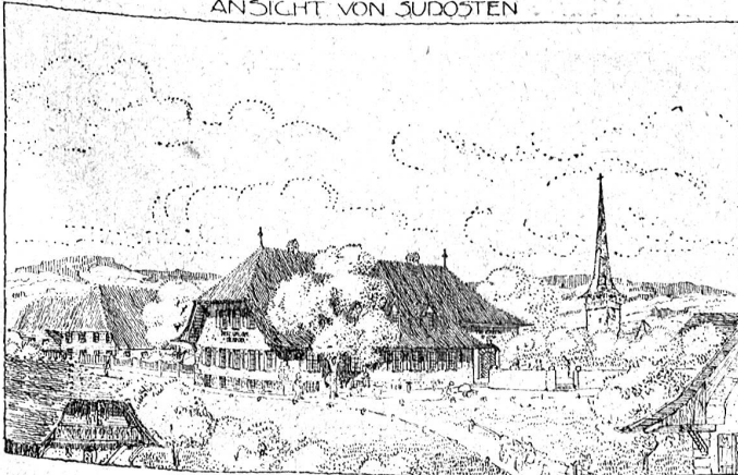
Aus dem Wettbewerb für Gemeindestuben und Gemeindehäuser: „Bärnbiet“. Ehrenmeldung. Arch.: Ed. Lanz, Charlottenburg. Das Gemeindehaus ist als heimeliger Berner Gasthof gedacht.