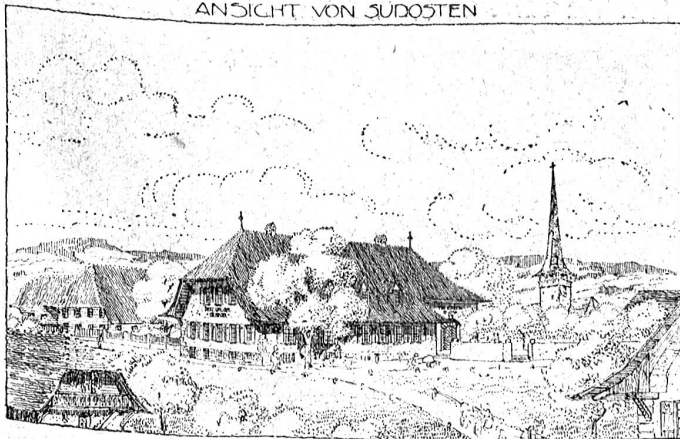
Aus dem Wettbewerb für Gemeindestuben und Gemeindehäuser: „Bärnbiet“. Ehrenmeldung. Arch.: Ed. Lanz, Charlottenburg. Das Gemeindehaus ist als heimeliger Berner Gasthof gedacht.