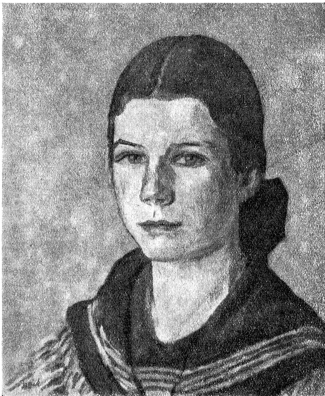
Max Brack: Mädchenkopf. (Aus dem Kunstsalon Ferd. Wyß, Zeitglocken 4, Bern.)