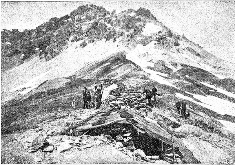
Gebirgsunterstände von schweizerischen Truppen an der österreichisch-italienischen Grenze.

Dem unsere Soldaten ihre Barackenlager am Ofenberg verlassen konnten. Kilometerweit begegnet man keinem menschlichen Wesen und kann so interessante Blicke werfen in die ungestört sich entwickelnde Tierwelt, steigen doch bisweilen die Hirsche und Gemsen bis auf die Wiesen des Fuornhotels hinab.