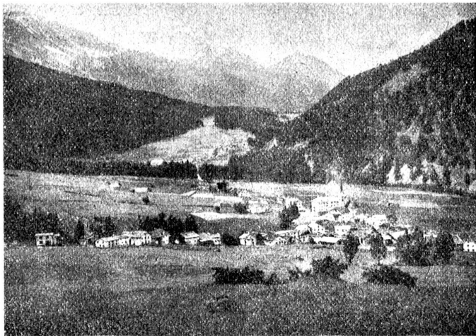
Santa Maria im bündnerischen Münstertal.

Aber nach Santa Maria gelangt man nicht so rasch. Darüber muß ich doch noch einige Worte verlieren. Die wenigsten Leute werden es haben wie Sven Hedin bei seinen Forschungsreisen in Zentralasien, für den einige hundert Kilometer Entfernung eben keine Entfernung waren, besonders dann nicht, wenn die Ferien nur kurz bemessen sind. Ein Gang ins bündnerische Münstertal will erkauft sein. Freilich, man kann ja in Zernez, der engadinischen Bahnstation, in die Post steigen und mühelos über den Ofenberg fahren, wenn man für die einfache Fahrt 13 Fränkeln abladen will. Ich zog es aber vor, die 36 Kilometer bis Santa Maria mit meinem Stahlroß zu verdienen, und ein taufrischer, strahlender Sommermorgen — der Kalender zeigte den 31. Juli 1919 — fand mich schon inmitten der einsam stillen Ofenbergreservierung unseres schönen Nationalparks. Und wie vordem liegt die träumende Stille wieder über Wäldern und Schluchten, seit-