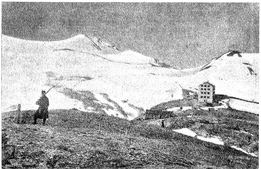
Wachtposten in den Bergen

Nun zog es uns aber hinauf zur Dreisprachenspitze. Westlich von Umbrail-Mitte steht, auf scharf vorspringendem Felsfegel, das Hotel Dreisprachenspitze. Es befindet sich, von einem flug berechnenden Tiroler dorthin gestellt, auf dem südöstlichsten Punkt unseres Schweizerlandes. Raum war die Dreisprachenspitze breit genug, um das Hotel hinzustellen. Nochmals heißt's 350 Meter höhwärts. Ein guter