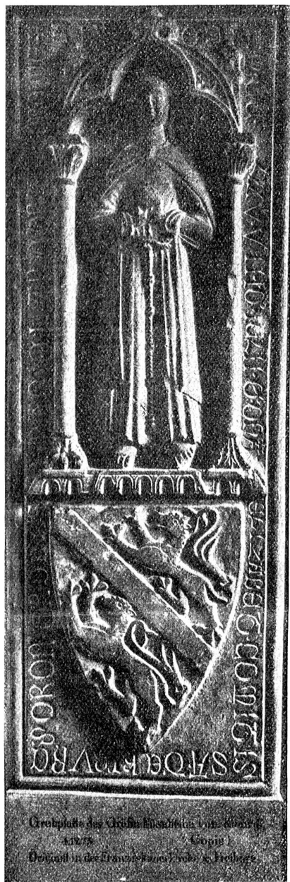
Großplatte des Grafen Elisabeth von Burgund 1275 (Göpp) Original in der Franzosenkirche in Freiburg

bei Nacht in eines andern Kraut oder sonst wird er für einen Dieb gehalten;