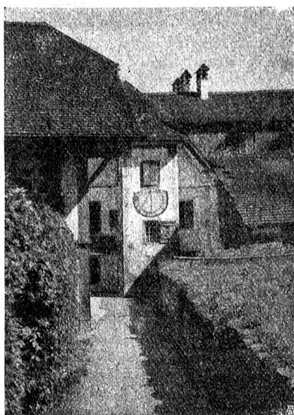
Alte Sonnenuhr auf dem Hofe zur Neubrücke bei Bern. Die Uhr befindet sich in einem malerischen Winkel an viel begangenen Fußweg und wurde jüngst durch Renovieren vor dem völligen Verfall bewahrt; sie hat Viertelstunden-Einteilung.

Das Thuner Schloß mit seinen vier Ecktürmen, das so stolz in die Lande hinausschaut und das Historische Museum beherbergt, wurde um das Jahr 1191 durch Herzog Berchtold V. von Zähringen nach dem Vorbild der zeitgenössischen französischen Schlösser errichtet, vielleicht auf römischen, vielleicht auf frühmittelalterlichen Ruinen. Nach dessen, im Jahre 1218 erfolgten Tode kamen Schloß und Herrschaft Thun durch Erbschaft an Graf Hartmann den Jüngern von Kyburg, der in zweiter Ehe mit Elisabeth von Châlons verheiratet war. Diese überlebte ihren im Jahre 1263 verstorbenen Gatten noch um 12 Jahre. Sie starb im Jahre 1275. Diese Elisabeth verließ der Stadt Thun im Jahre 1264 eine Handfeste oder Stadtordnung, die allerdings eine beinahe wörtliche Abschrift der Handveste der Stadt Freiburg im Aechtland ist, aber für Thun von solcher Bedeutung war, daß