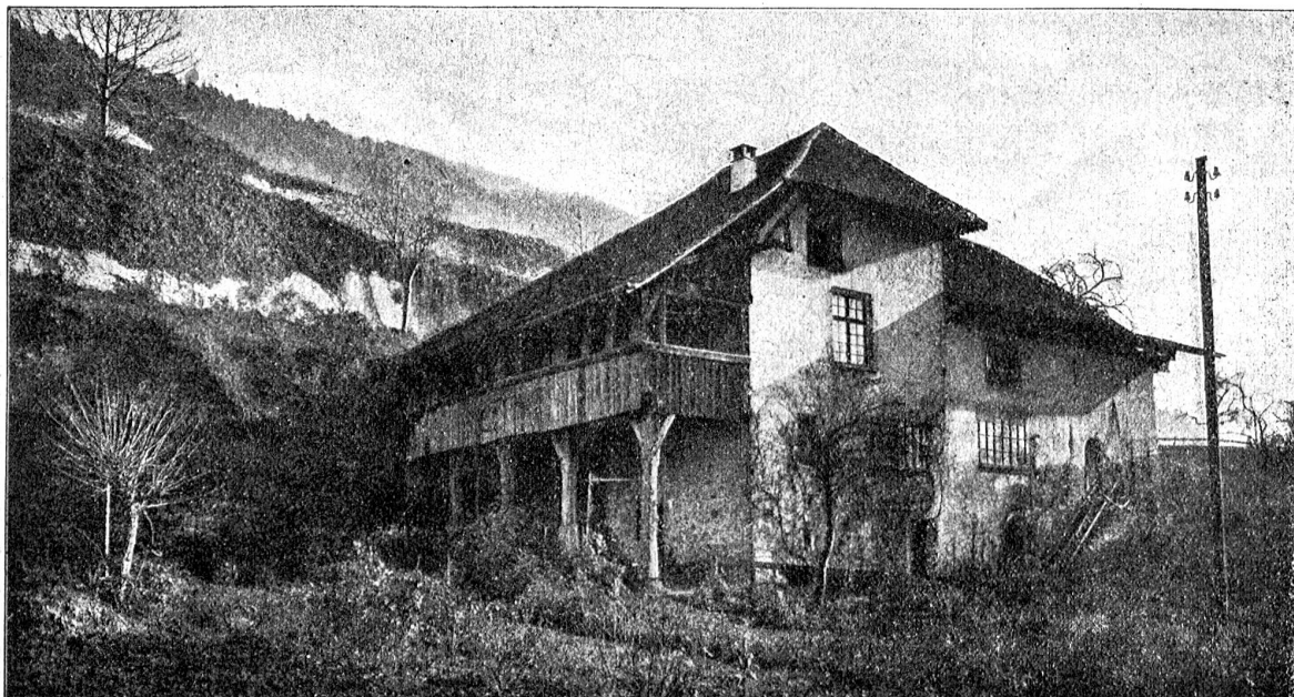
Das sogenannte „Heidenhaus“, ehemaliges Herbst- oder Rebhaus des Klosters Interlaken, in Oberhofen.

Endlich sagte ich: „Das war gar wunderbar, Renate; du bist gar sehr erschrocken!“