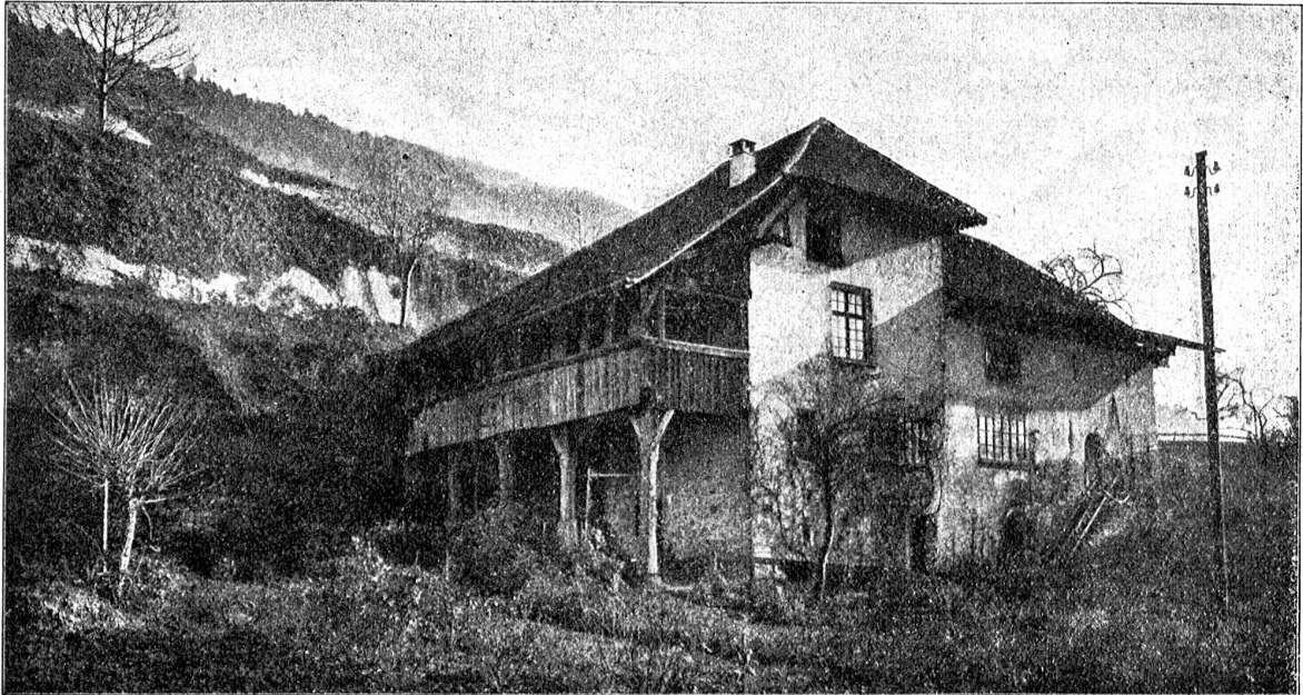
Das sogenannte „Heidenhaus“, ehemaliges Herbst- oder Rebhaus des Klosters Interlaken, in Oberhofen.

Endlich sagte ich: „Das war gar wunderbar, Renate; du bist gar sehr erschrocken!“