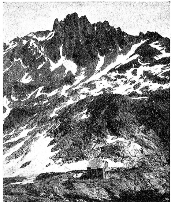
Reutlingerhütte und die Pflunspitzen (Vorarlberg).

können, zudem nach außen nie eine Einheit darstellend, ist das Land in stete Mitleidenschaft gezogen durch die Schweizerwirren nicht minder als durch die Kämpfe des Hauses Habsburg um den Schweizerbesitz. Als Rudolf von Habsburg mit St. Gallen in Fehde war, traten Bregenz und Feldkirch auf die Seite dieser Stadt, und als sie unterlag, hielt Vorarlberg zum Bischof von Chur, der im Verein mit Zürich den Kampf gegen Albert von Oesterreich fortsetzte. Bald darauf zerstörten die St. Galler, vereint mit dem Grafen von Bregenz, Altstätten, um dann im Auftrage des Kaisers Feldkirch zu belagern, welches die Reichsobrigkeit nicht anerkennen wollte.