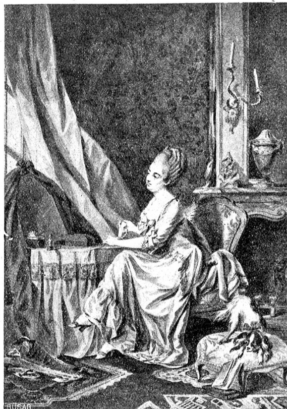
S. Freudenberger: Junge Frau in ihrem Boudoir. — 1768.

phäischen Professor Thomasius, der in seinem derzeit erst verdeutscheten Buche „De crimine magiae“ all Teufelsbünd-