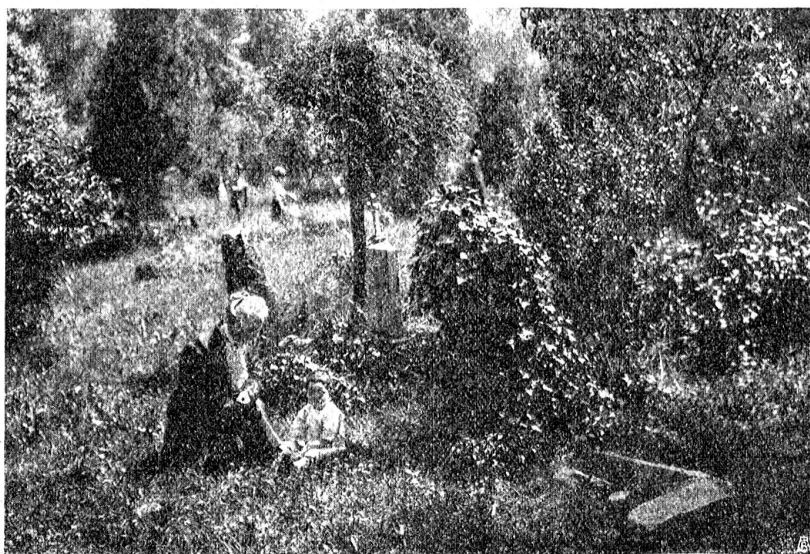
Aus dem ehemaligen Rosengartenfriedhof in Bern.

herrschaftliches Aussehen, und hätten nicht verwitterte Grabsteine und vom Rost zerfressene schiefe Eisentreuze zwischen den Trauerweiden und Zypressen den alten Begräbnisplatz erkennen lassen, man hätte an den verbotenen Paradiesgarten gedacht. Sonntags indessen war die „Rosengarten-Promenade“ dem Publikum geöffnet, und man konnte sich die Anlage von innen ansehen. In dem Maße aber, wie die alten Grabstätten die gehobene Stimmung der Lustwandelnden dämpften, hemmten taunasse Gebüsch und feuchte Wege seine Schritte, und eine „Promenade“ im eigentlichen Sinne des Wortes war der „Rosengarten“ nicht. Es wäre aber eine Verfündigung am guten alten Berner-geiste gewesen, wenn der verlassene Friedhof nicht dazu umgewandelt worden wäre durch die Hand des Stadtgärtners. Denn es ist wohl im Sinn und Geist jener Männer des alten Bern gehandelt, die zum Genuße der künftigen Geschlechter die Umgebung der Stadt durch die weitläufigen und kostspieligen Baumanlagen so reizvoll gestalteten, wenn auch die ehrwürdigen gewaltigen Ulmen- und Ahornreihen des ehemaligen „Rosengartens“ erhalten blieben und für die Verschönerung der Stadt nutzbar gemacht wurden.