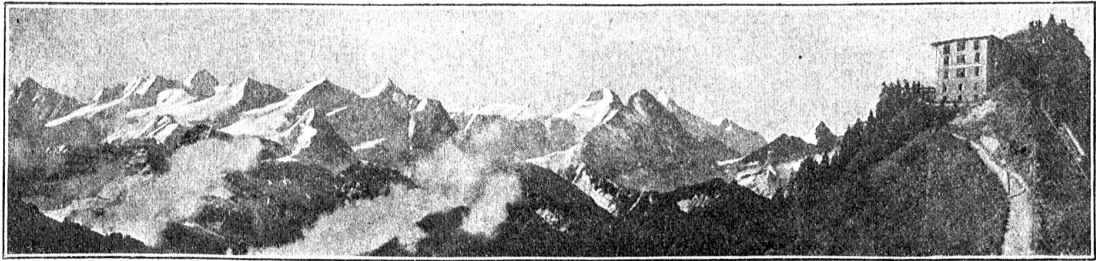
Die Berner-Alpen vom Stanserhorn aus.