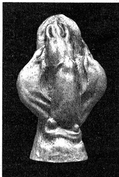
Paul Bay, Beatenberg: Schwellende Knospe. Studie in Gips.

Wirklich, die lebendigen Geschöpfe der Natur und ihre vom Künstler geformten Bilder fließen uns zusammen in eins, daß wir von diesen gleich wie von jenen reden müssen.