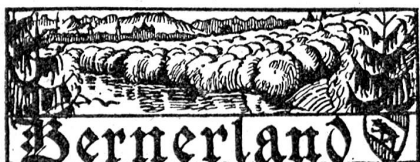
† Oberst F. Bigler.

In Basel hielt Nationalrat Gelpke einen Vortrag über das Rheinproblem und den Friedensvertrag. Er forderte statt der Kanalisierung des Rheines dessen Regulierung, womit sowohl der Schifffahrt wie der Kraftgewinnung gedient ist. Die Schweiz muß alle Anstrengungen machen, daß ihr in Paris das Recht auf die freie Rheinschifffahrt gewährleistet wird.