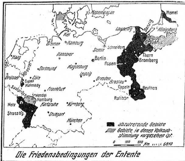
Kartenskizze zu den Friedensbedingungen der Entente.

lage der Vertragsbestimmungen werden die vierzehn Punkte Wilsons betrachtet. Leider hat man das Gebäude neben das Fundament gestellt. Bedauerlicher als diese Bauweise