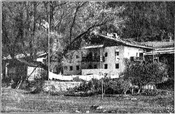
Das Sandwirts Haus Andreas Hofers Geburtshaus.

Mit solch unheilbarem Tirolerheimweh im Herzen sah ich einmal weit fort von daheim auf der sonnigen Veranda eines Strandhotels. Es war in Sydney in Australien. Ich sah über das Meer hinaus und dachte an die Heimat.