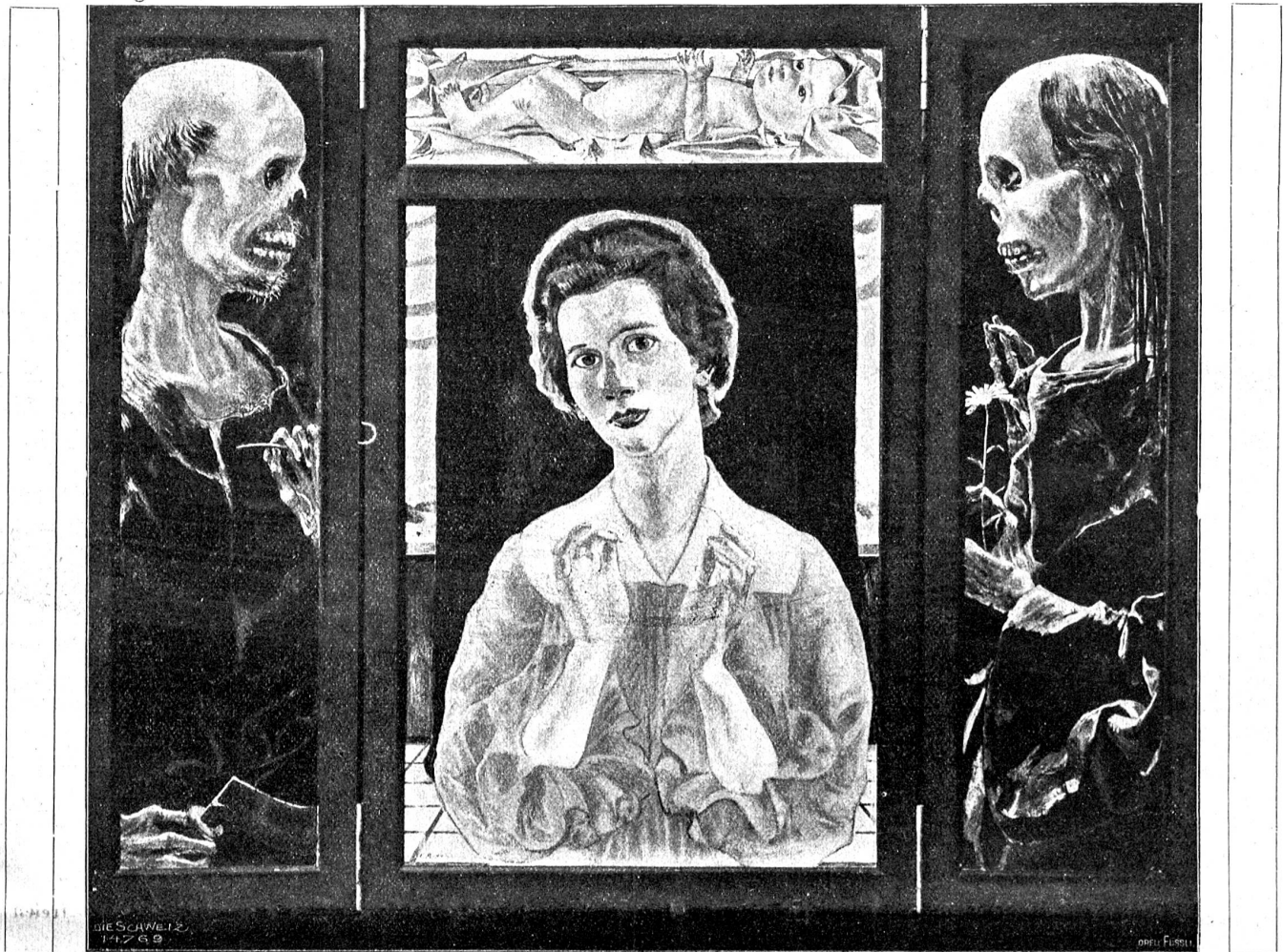
Cuno Amiet: Triptychon: „Hoffnung“.

geformten, zum Teil höchst abenteuerlich aussehenden Eisenstücken, die der Bub der Kukud weiß wo zusammengelesen haben mochte. Sein altes Schmiedenhertz ging ihm wieder auf und die alten Hände wurden plötzlich wieder gierig, etwas anzupacken und zu häscheln.