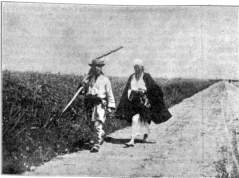
In der fruchtbaren ukrainischen Ebene.

In den Jahren 1790—1795 brachte der Zar nun auch die Hauptmasse des Ukrainergebietes an sich: Durch die zweite und dritte Teilung Polens nahm Rußland damals Podolien, die Westukraine, Wolhynien