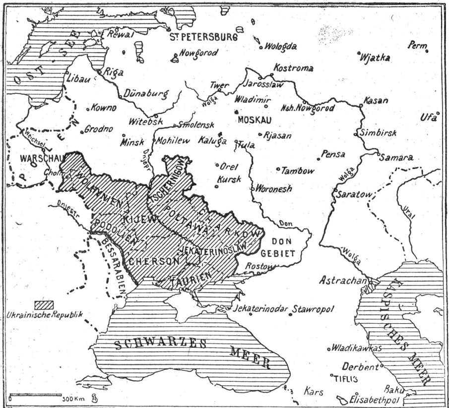
Die nunmehr feststehenden Grenzen der ukrainischen Republik.

Allein schon unter seinen Nachfolgern zeigte sich die russische Herrschertendenz; der Hetman rang um seine zugestandenen Rechte und suchte die 1667 von Rußland und Polen entzogenen Gebiete von Kiew und Poltawa in die nationale Bewegung hineinzuziehen. Die russische Partei in dem Lande, das eben noch unter polnischem Joch geknechtet hatte, war zu stark. Der Aufstand unterblieb. Unterblieb um so mehr, als Kiew die Rolle des russischen Roms zu spielen anfing: Die Geistlichkeit stund ganz auf der Moskowiterseite. Nicht umsonst hatte sie unter polnischer Herrschaft unaufhörlich gegen die Katholiken gerungen. Sie war jetzt froh über die neue Rolle