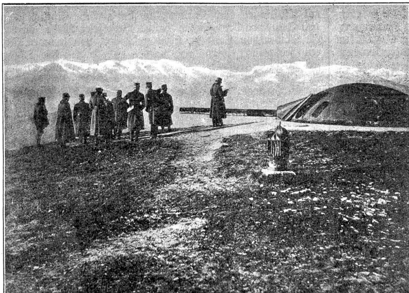
Kaiser Karl von Oesterreich auf der Cima di Campo.