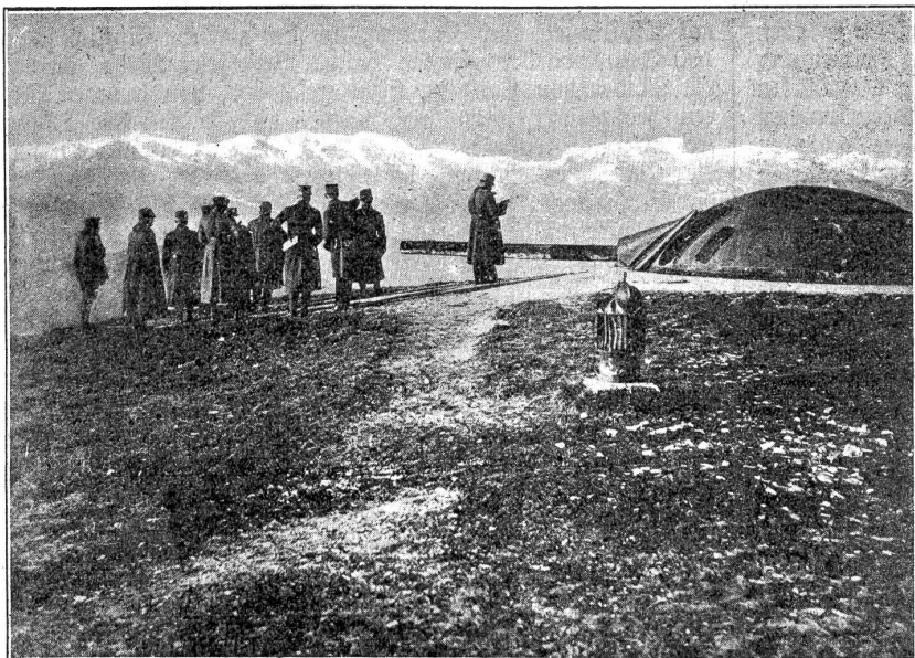
Kaiser Karl von Oesterreich auf der Cima di Campo.