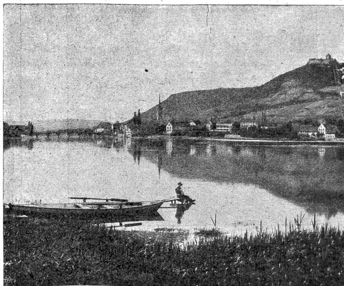
Stein a. Rh. vom Fluß aus gesehen.

Die ersten Fremdlinge, die in das Land einbrachen, waren die deutschen Schwertbrüder, eine christliche Rittergesellschaft, gegründet zum Zweck der Eroberung irgend eines „heidnischen“ Landes. Sie faßten festen Fuß in Livland, das ihnen bis 1237 gehörte und arbeiteten den deutschen Ordensrittern vor. Der deutsche Orden arbeitete in Preußen vielleicht fünfzig Jahre an der Eroberung und faßte dann in Kurland Fuß, erbt die Trümmer des Schwertbrüderstaates, dann 1346 auch Esthland. 1384 eroberte er das littaunische Szemaiten („Niederland“, sprich Schemaiten) mit Kaunas. Um 1400 stund der Ordensstaat in höchster Blüte. Man suchte auf der Karte und denke sich als geographische, staatliche unabhängige Einheit die heutigen Länder West- und Ostpreußen, Szemaiten, Kurland, Livland und Esthland. Die innere Verfassung des Staates glich aufs Haar der türkischen. Statt des Sultans hieß der Führer des Herrenvolkes Großmeister. Wie die Türken über die Christenvölker, so setzten sich die Ordensritter über die baltischen Heiden als Adel, verteilten Land und Leute unter sich als Beute und genossen die Früchte fremder Arbeit. So sah