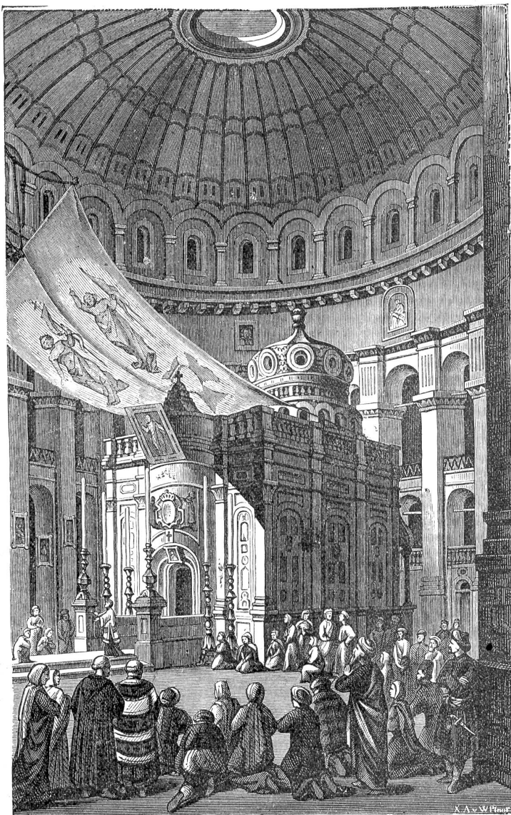
Das Innere der Grabeskirche mit der Grabkapelle, die die genaue Stelle des Grabes Christi bezeichnen soll.

Dann stürzt man sich wieder vorwärts mit steigender Hast dem Untergang entgegen.