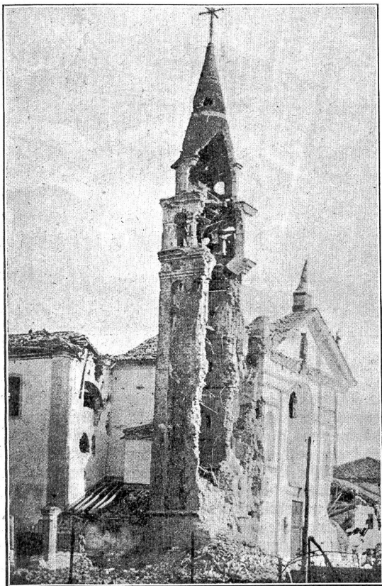
Vom italienischen Kriegsschauplatz: Der aufgeschlachte Kirchturm in Pontes di Piaves.

setzung sehe. Also: Daß es in die verkappte Annexion willige. Kühlmann redet in kühleren Sätzen, die aber inhaltlich dasselbe bedeuten. Die Begründung der deutschen