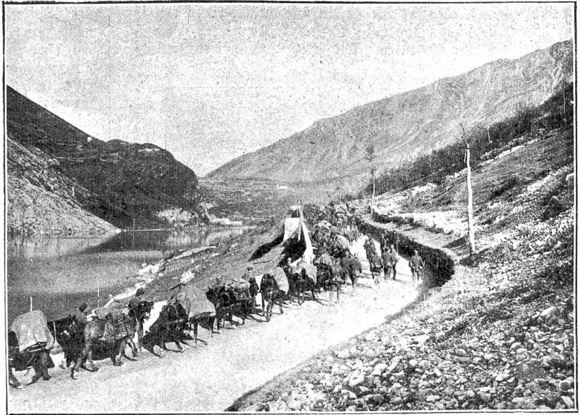
An der Plavefront: Deutsche Bagage am Lago di Morto.

Italien verlangte bekanntlich die gesicherte Ostgrenze Venetiens und stützte seine Annexionsabsichten auf das italienische Volkstum dieser Grenzgebiete. Die Mindestforderung umfaßte aber das gesamte Fsonzotal und Istrien, samt einem Landzusammenhang beider Gebiete über dem Karst und das Wippachtal. Die vorhergehenden Ausführungen mögen zeigen, wie unzureichend solche Annexionsgründe sind und wie sehr sie sich selber widersprechen. Der Kampf gegen Oesterreich als Staat wird vom italienischen Volk vielfach als ein Krieg des welschen Volkes gegen den deutschen Feind betrachtet. Natürliche Verbündete gegen die nordischen Barbaren sollen die Südslaven sein, also auch die Slowenen. Das italienische Kriegsziel geht darauf hinaus, die rein slowenischen Bergtäler des obern Fsonzo zu annektieren, geht darauf hinaus, die von Slowenen rings umgebene Handelsstadt Triest samt einem ganz slowenischen Hinterland in Besitz zu nehmen. Ein Blick