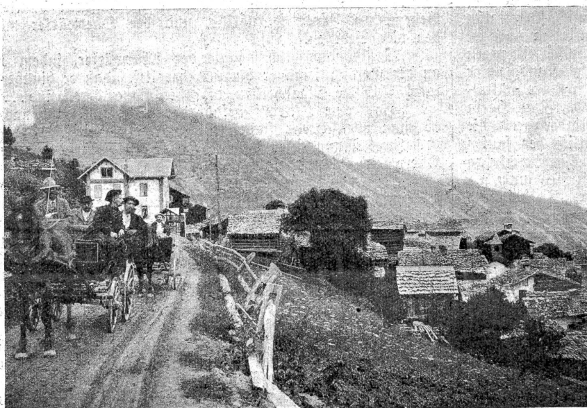
Das Dörfchen Euseigne (Ersingertal, Wallis) vor dem Brande.

Plötzlich blieb er stehen und erbleichte. Dann biß er auf die Zähne und blickte scharf und entschlossen auf eine Eiche hin. Vorsichtig schritt er näher. Das Herz klopfte ihm zum Zerspringen laut: da hinten stand einer. Vielleicht ein Häfcher. Hatte man es doch schon gemerkt, daß er fehlte? Nun, so leicht sollten sie ihn nicht fangen. Unheimlich durchbohrte sein Auge das Dunkel. Er wollte sicher sein und trat auf die Eiche zu. (Schluß folgt.)