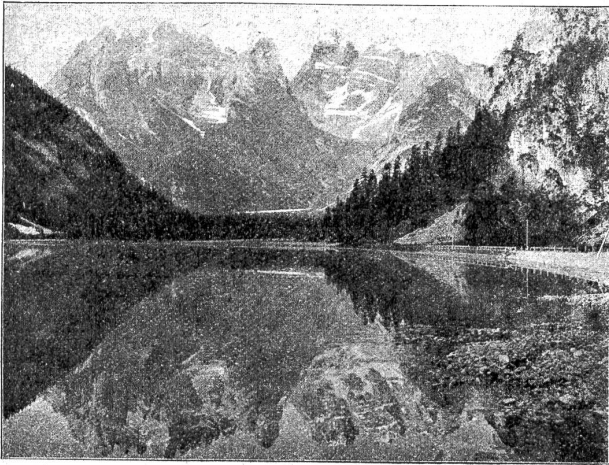
Aus dem Tirol: Der Dürrensee.

jener Zeit, da man zum erstenmal erhoffen kann, was der jüdische Prophet vor Jahrtausenden lehrte: „Nicht mehr wird Volk gegen Volk das Schwert erheben. Nicht werden sie ferner lernen den Krieg.“