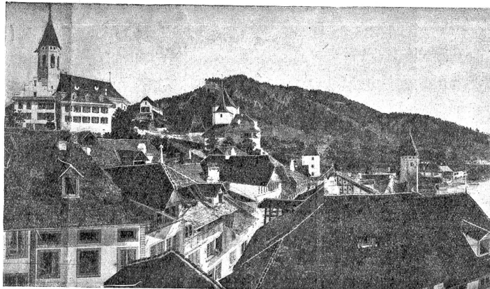
Das Panorama von Thun.