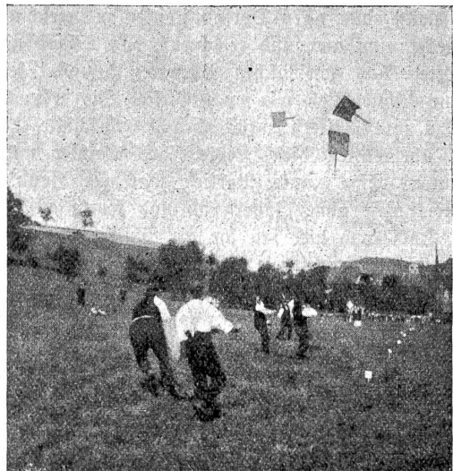
Vom Hurnussertag in Heimiswil: Gesellschaft Busswil.

„Wenn-i se so gseh hurnusse“, sagt eine Bäuerin zu mir, „so chunnt mir gäng d's Augewasser.“ Nun hat das Hurnussen gewiß nichts Sentimentales. Warum denn die Träne? Gedenkt die Frau ihrer armen Mitschwester, deren Männer in blutigem Kampf stehen, in heißem Ringen täglich dem Tod ins Auge schauen und deren Söhne fallen „wie Kräuter im Maien“? Sieht ihr Auge, das hier auf reicher Fülle ruhen darf, jene Armisten, die Haus und Hof verlassen mußten und die bei ihrer Wiederkehr die Heimat nicht mehr erkennen, denn Trümmerhaufen sind ihre Häuser, Schuttfelder ihre fruchtbaren Gefilde und der Boden gibt Steine statt Brot. Wer begreift da nicht die Träne des Mitleids? Oder strömt ihr Herz über von Dank? Von Dank für all das Gute, das dem Volk auf der Friedensinsel vor allen andern beschieden ist? Ist es eine Träne der Freude über die Fülle gesunder Kraft, die nach Wochen harter und strenger Arbeit nicht erschöpft und nicht ermattet der Ruhe begehrt, sondern im Spiel neu sich verjüngt? Der Freude über das Festhalten an dem alten schönen Brauch, der schon