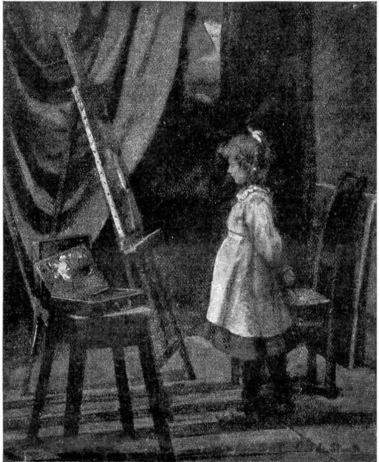
E. de Stoutz, Genf †: Bewunderung.