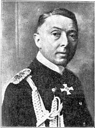
Von Hintze, der neue Staatssekretär des deutschen Auswärtigen Amtes.

Marne wurde von Amerikanern in der Entwicklung gehemmt. Stellenweise nahmen die Deutschen Stücke der verteidigten Linien; im Ganzen brachen sie aber vor den ersten