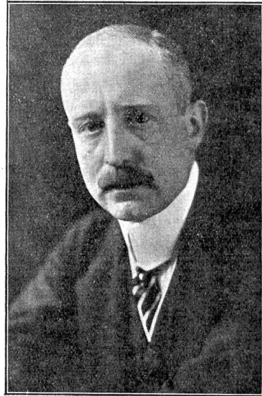
Graf Mirbach, der in Moskau ermordete deutsche Botschafter.

das unter dem Eindruck der Niederlage am Piave zu tagen beginnen soll? Die Eroberung von Reims würde dem Kabinett Seidler Halt gewähren.