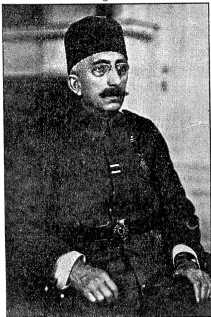
Zum Chronwechsel in der Türkei: Sultan Mehmed VI.

Die Wichtigkeit der von den Franzosen angegebenen Ziele der Deutschen liegt auf der Hand. Ein Vordringen marneaufwärts würde Verdun genau so in den rückwärtigen Verbindungen treffen wie 1914. Uebertreibt nun die durch das lange Warten nervös gewordene Entente? Welchen