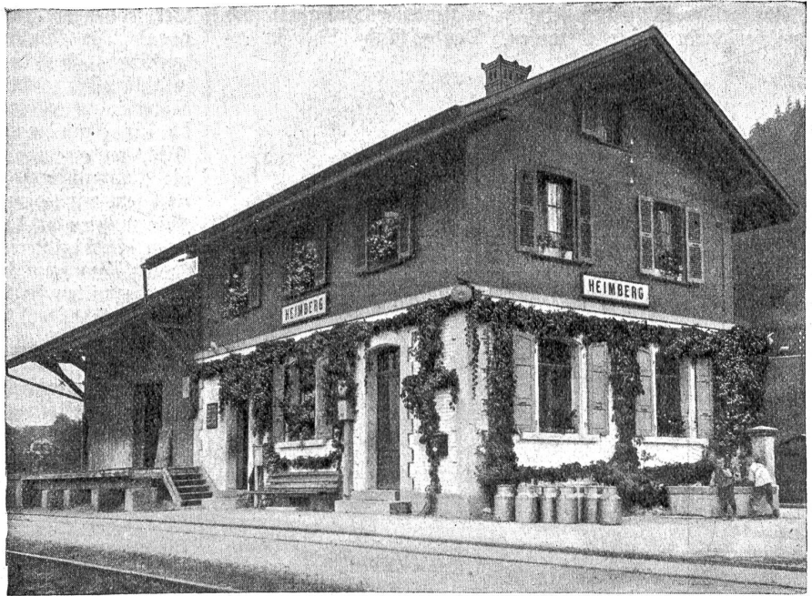
Station Heimberg (an der Linie Burgdorf-Chun). Mit wilder Rebe und mit Blumenstöcken geschmückt.

Unter allen Schlingern hat wohl die wilde Rebe die größte Verbreitung. Und gewiß mit Recht. Ohne Pflege und ohne Winterchutz gedeiht sie überall, hohe Lagen ausgenommen. Rasch erklettert sie Mauern und Wände, klettert bis zum Dach empor und sendet ihre Ranken wieder zurück, in diesen leicht und lose flatternden Kränzen ihre höchste Daseinsform erreichend. Die wilde Rebe ist lieblich zu schauen, wenn sie mit ihrem jungen Grün tote Wände belebt und den Frühling auf leeres, totes Mauerwerk zaubert. Ihre grüne Fülle täuscht über manches weg, das besser verborgen bleibt. Aber erst ihr Welken! Wenn die Matten