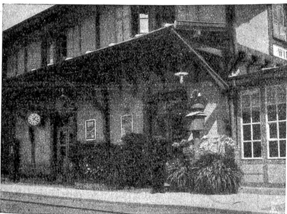
Station Wichtrach (an der Linie Bern-Chun). Hübsch gruppierte Blumenstöcke, namentlich Agapanthus von kräftiger Wirkung („Heimatschutz“).

Nach Davos müssen wir reisen, wenn wir das reichst und schönst geschmückte Stationsgebäude sehen wollen, das wohl in der Schweiz zu finden ist: Fideris. Es lohnt sich, dort auszustiegen. Vom blumenfreudigen Herrn Vorstand vernehmen wir Näheres über die prächtige Anlage. „Wand- und Säulenverkleidung besorgt die wilde Rebe. Das Blumenbeet (Stirnseite) ist mit gewöhnlichen roten Geranien bepflanzt und, sind die noch sichtbaren Steine mit Steinbrechpflanzen und Steinmellen verdeckt, so entteht eine Art grüner Teppich. Darüber im Längsgestell eine Reihe hell- und dunkelroter Hänge- oder Efeu geranien und darüber als zweite Serie rote Geranien. Rings um den Rand des Verandadaches deckt ein Steinbrechteppich, zirka 1 Meter breit und überhängend, die Holzverkleidung. Dahinter eine