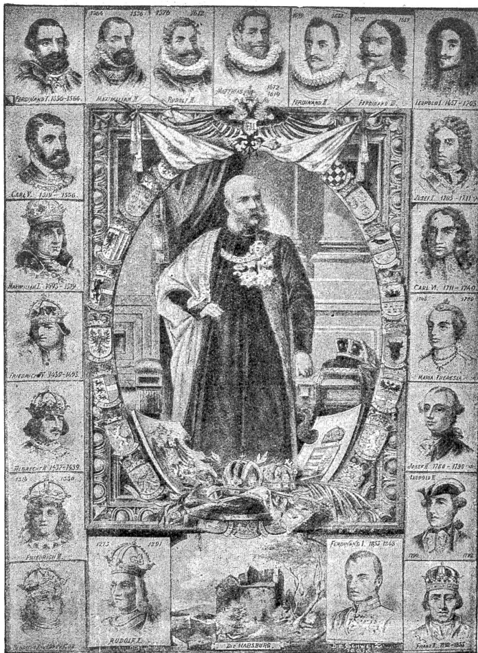
Genealogische Tafel der Herrscher aus dem Hause Habsburg von Rudolf I. (1273–1291) bis auf Franz Joseph I.

der da fliegt, dann könnte ich fortfliegen und brauchte nicht da hinauf in die rote Hölle. Schau, der Schnee schmilzt von meinen Tränen, die darauf fallen, aber das böse Herz schmilzt nicht, und mein Vater ist ganz verwandelt. — Sie konnte vor Weinen nicht weiterreden und die andere ging von dannen. Die Weinende kehrte nach der Mühle zurück. Ich hielt mich nicht, ich trat ihr in den Weg, ich bereute es fast, es lag ein großer Schmerz auf dem jugendlich schönen, frischen Antlitz, ich hätte ihr gern einen Trost gesagt, aber ich wußte nicht, was ich vorbringen sollte, ich sagte ihr nur einfach guten Tag. Sie sah mich groß an, stand einen Augenblick still verwundert, dann ging sie ihres Weges.“