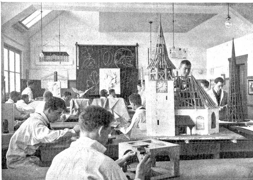
Zeichnen und Modellieren. (Abteilung für Hochbau.)

dem Vorsitz von Architekt A. Tiedhe arbeitete im Auftrag des Regierungsrates in wenigen Monaten den Plan für eine kantonale Gewerbeschule mit einer baugewerblichen, mechanisch-technischen, einer chemischen Abteilung und einem halbjährlichen Vorkurs aus. Die jährlichen Betriebskosten wurden auf 70,000 Fr., die ersten Einrichtungskosten auf