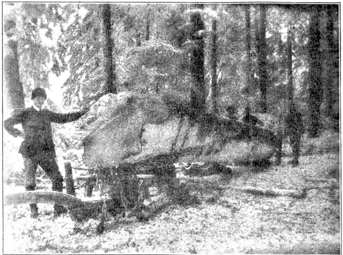
Der grosse Weissstannenträmel, im Walde aufgenommen.

Gerne nennt man den Bauer rückständig, spöttelt wohl über seinen Gang zu allem Althergebrachten. Aber gerade diese mit Unrecht belächelte Rückständigkeit hat etwas Erhaltendes; sie gibt dem Bauer die Stetigkeit in Sitte und Brauch. Wo der Bauer anfängt, diese seine Eigenart zu opfern, wo er aufhört, den Speicher mit Gaben zu füllen, wohl aber die Mittel modernen Verkehrs sich dienstbar macht, und das, was er selbst anbauen könnte, in der Stadt kauft, da spürt der Städter in erster Linie den Wandel der bäuerlichen Eigenart. Solch ein Bauer ist nicht mehr Bauer im guten Sinne des Wortes; er wird zum kalt