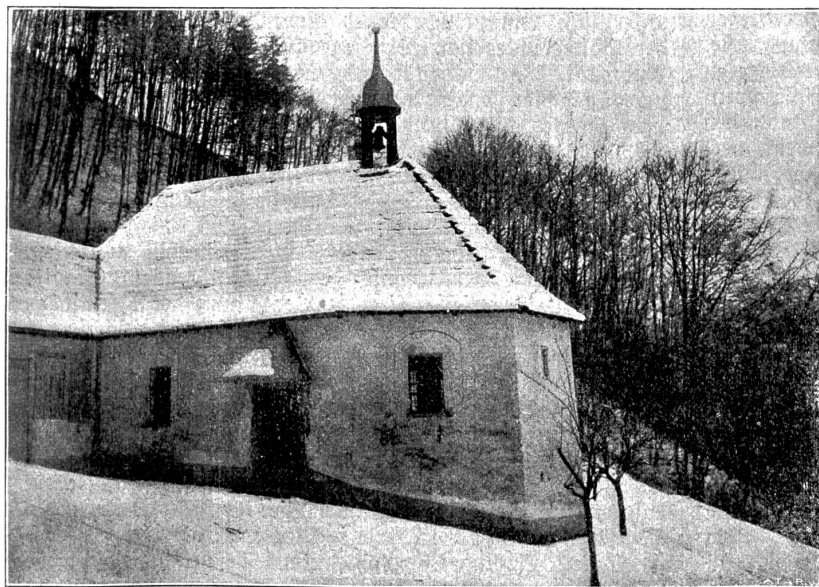
Zur 500. Gedenkfeier an Niklaus von der Flüe (21. März 1414-1917). Die Bruder Klaus Kapelle im Ranft bei Schlüli.