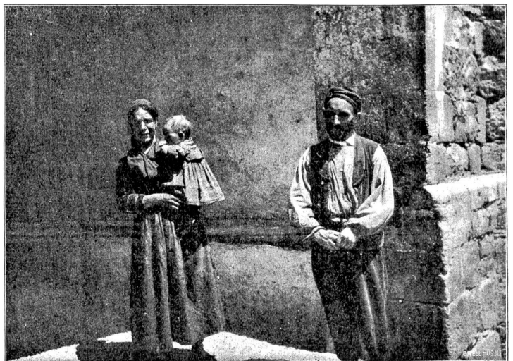
Küsterfamilie im spanischen Pyrenäenstädtchen Bielsa.

„daß der von zu Hause mitgebrachte Proviant, die gedörrten Landjäger und die paar Pfund Käse ihn für einige Tage den Nahrungssorgen entheben“. Seine Wanderungen