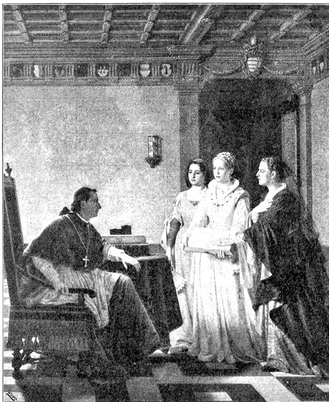
August Weckesser (1874). Die protestantischen Lokarnerinnen vor dem päpstlichen Nuntius. (Museum in St. Gallen.)

Es empörte ihn jeden Morgen, wenn er die Kinder, die blaß und hustend kamen, in dem feuchten Haus sitzen sah. Es roch nach Moder und Schimmel und war kellerartig feucht und kalt. Der Ofen heizte schlecht und rauchte. Stürmte es, so fuhren gelbe, lange Wolken den Wänden entlang. Die Kinder husteten auch im Sommer und, so