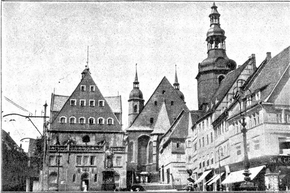
Marktplatz zu Erfurt mit dem Lutherdenkmal.

Flurtüre schloß sich. Rasch ging er zu Lis hinüber. Sie wollte ihn begrüßen, aber er wehrte ab.