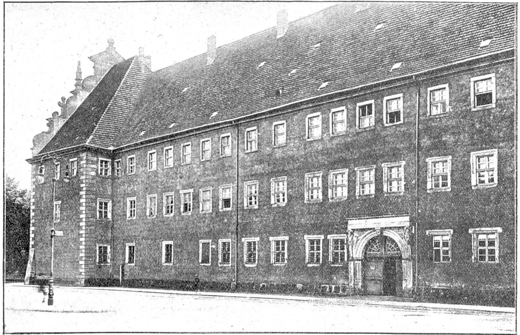
Das „Lutherhaus“ in Wittenberg (das ehemalige Augustinerkloster).

Wegweiser sind sie uns zunächst darin, daß ihr Lebens-