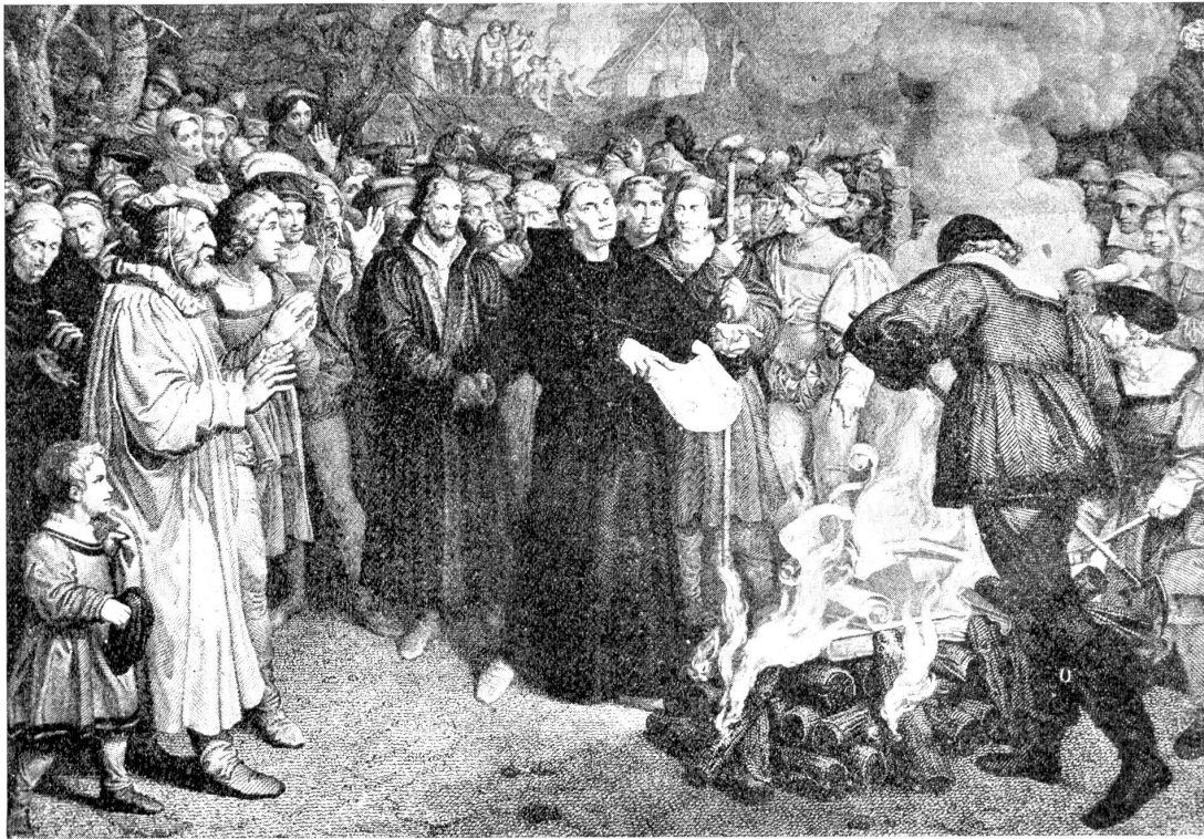
Die Verbrennung der Bannbulle am 10. Dezember 1520.

fachen und Entscheidenden läßt sich in die Worte fassen: Die Reformation zeigt uns einen neuen Ernst des sittlichen Kampfes, des religiösen Suchens und Findens, sie zeigt uns in neuem Lichte unsere Stellung zu Gott und dem Bruder, die Reformation hat uns wiederum an die Gottesoffenbarung in der heiligen Schrift gebunden, sie verkündet und fordert die lebendige christliche Gemeinde, sie hebt den Unterschied auf zwischen Profan und Heilig, indem sie das ganze Leben und Zusammenleben der Menschen als einen Gottesdienst aufgefaßt wissen will. Wir brauchen die von den Reformatoren wiederum auf den Leuchter gehobenen Wahrheiten und Tatsachen nur einen Augenblick uns gegenwärtig zu halten, so spüren wir schon, wie auch unsere Zeit und wir selber aus diesen Quellen Heilung und Hilfe bekommen würden.