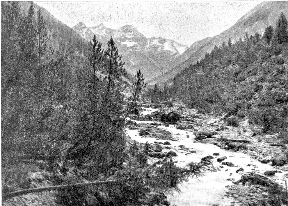
Aus dem Schweizerischen Nationalpark: Blick ins Val Cluozza, dem leichtest erreichbaren Teil des Parkes; der schäumende Bach im Vordergrund ergießt sich in den Spöl.

sie überschritten. Kleine Vogelspuren liefen wie eine zäsig gegliederte Kette über den Weg und bald danach folgten die runden Spuren einer Raqe, die sich dahin geschlichen haben mochte, um den Frieden des Vögelchens zu stören. Eiszapfen hingen spitz und wasserklar an einem kleinen Brunnen, an den sich ein Gänsemädchen lehnte, ihre bronzenen Tiere tränkend. Die Sonne verwandelte die Eiszapfen in Diamanten und Hates Nadel fiel Martin wieder