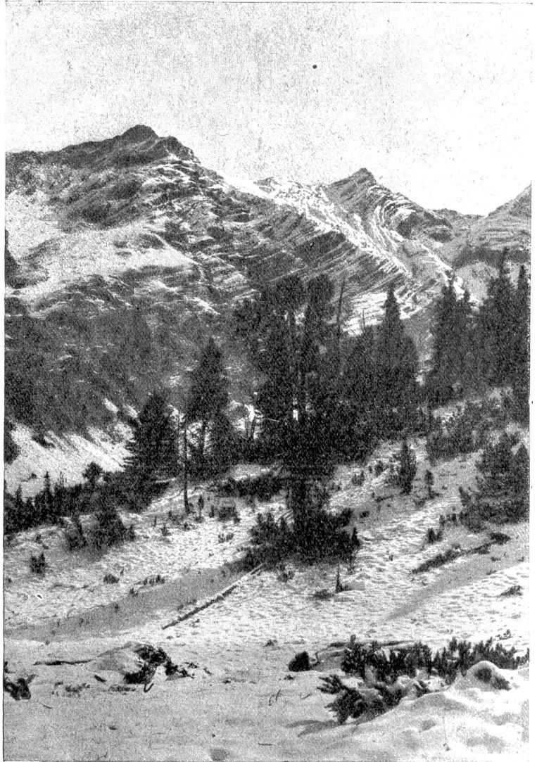
Aus dem Schweizerischen Nationalpark: Der Hintergrund des Val Cluozza. Im lichten Arven- und Tannenwald sind die Baumleichen erkennbar, die hier unberührt wie im Urwald vermodern.

Die Dämmerung macht rasche Fortschritte. Ihre Schatten werden länger, dunkler. Schon liegen sie im schweigenden Tal. Der Weg ist furchtbar steil. Und das ist gut. So werden die reinen Genuß- und Alltagsmenschen unserer herrlichen Cluozza-Reservat für immer fern bleiben. Ein Schnaufhalt! Der erste Blick ins Cluozza: Aus der engen Talfurche leuchtet das helle Wasserband des Baches einen kurzen Moment hinauf. Drüben schimmern die weißen Schneeflächen des Biz del Diavel, des treuen Grenzwächters, mit dem letzten Licht der erlöschenden Dämmerung. Aus